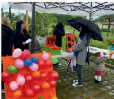
Dehors, le stand de jeux anciens a dû composer avec les averse...