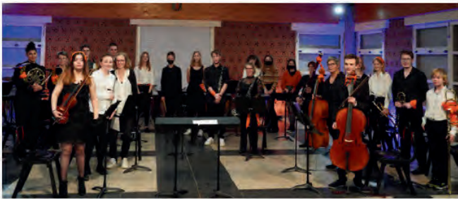
Quel plaisir de se retrouver pour jouer en public!

L'association Orizon a donné samedi son tout premier concert de restitution de stage d'orchestre, à la Maison du temps libre.