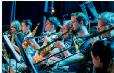
L'Orchestre symphonique de Valenciennes.

BOÛLE MUSIC - Samedi, un orchestre symphonique du Nord va monter sur scène pour donner un concert assez particulier avec, dans sa playlist, un seul et unique morceau pour trois heures de spectacle