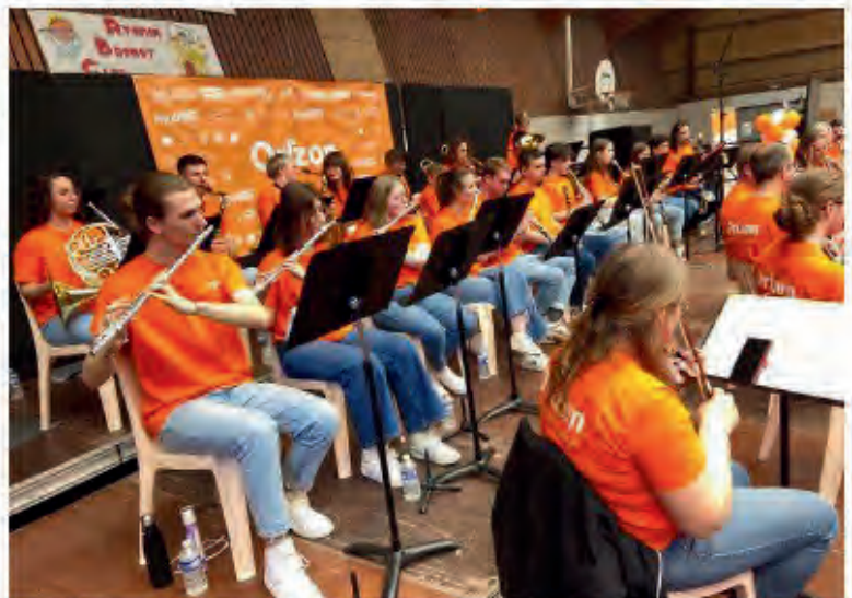
Trente-cinq musiciens étaient rassemblés pour tenter de jouer pendant trois heures ce qui est considéré comme le premier morceau de la musique minimaliste.

10 secondes de la fin, le public fait le compte à rebours, et puis ça y est, il est 18 h, le record est battu ! Les musiciens debout s'applaudissent. Après 3 heures de ce pari fou, pas question d'un bis ! Mais l'orchestre tient à commémorer encore quelques instants avec le public en interprétant Dans les yeux d'Émile de Joe Dassin, dans sa version remise au goût du jour, par les bandes du sud-ouest pour soutenir les équipes de rugby.