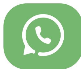
canaux de discussion